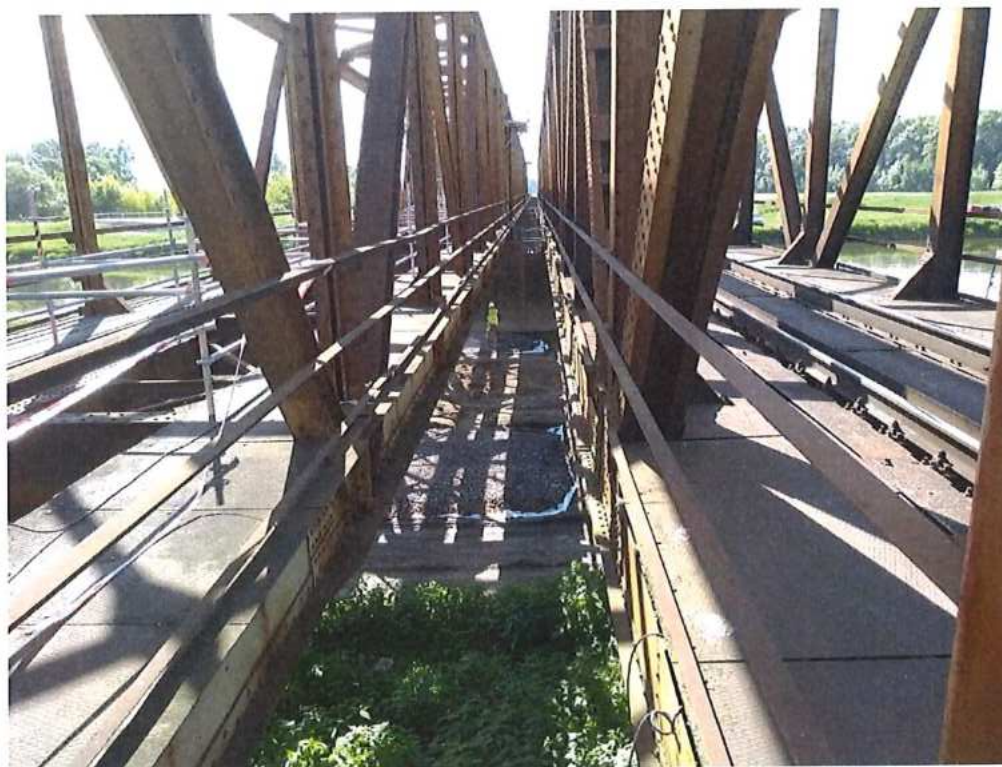
Práce na prístupovej komunikácii - CZ strana