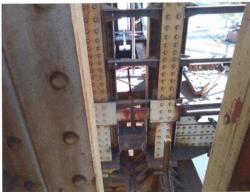
Príprava a montáž spevňovacích prvkov