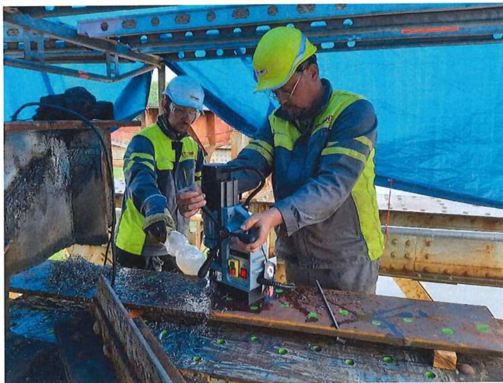
Príprava a montáž spevňovacích prvkov