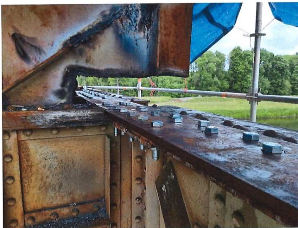
Príprava a montáž spevňovacích prvkov