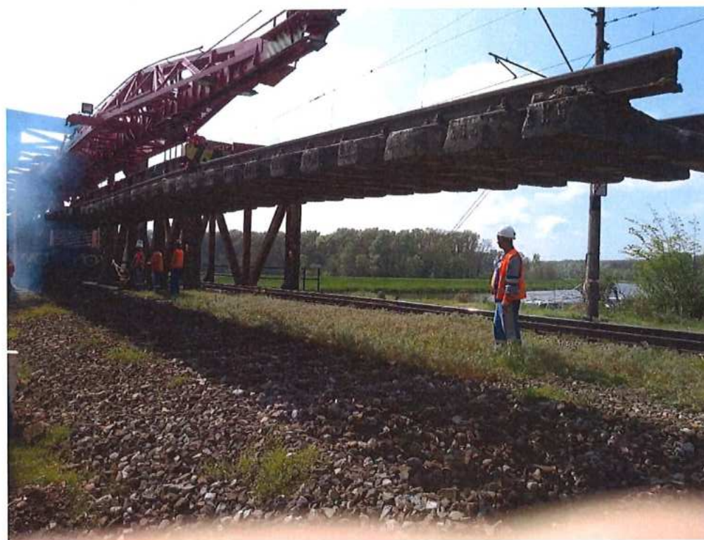
Demontáž koľajového zvršku