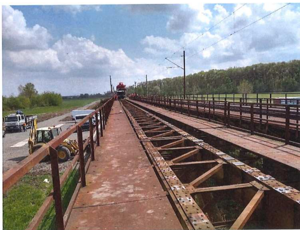
Demontáž koľajového zvršku na moste