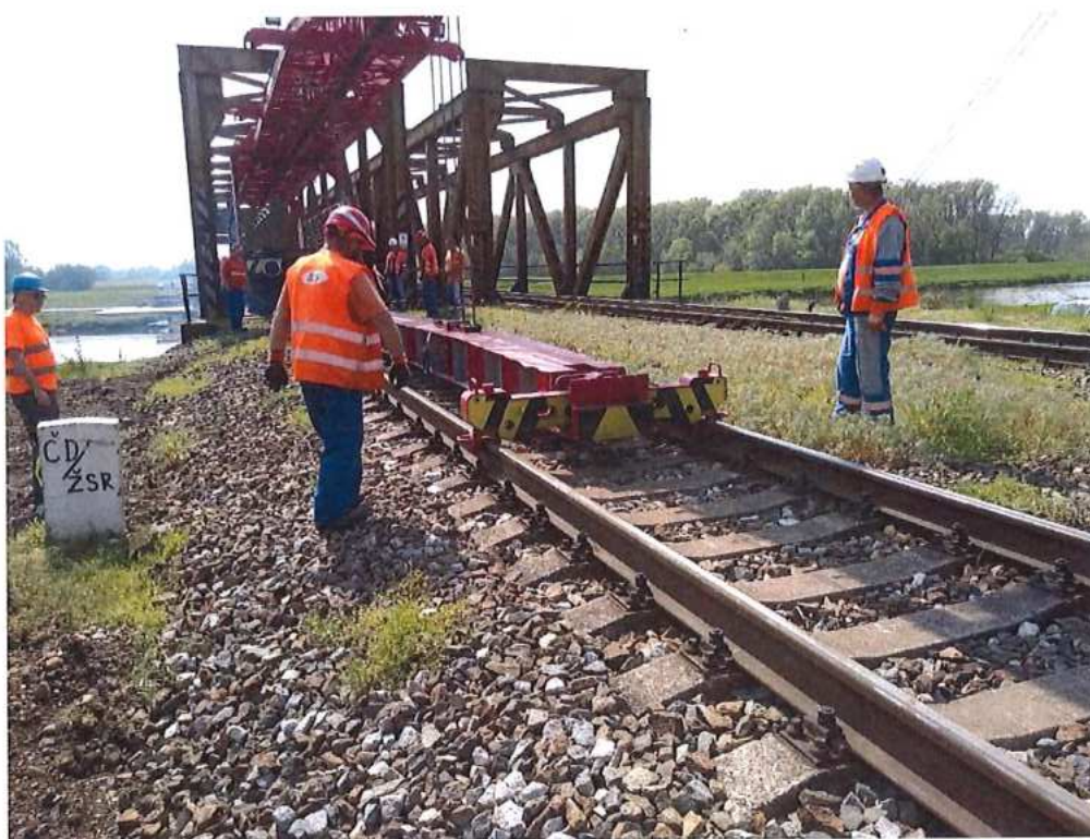
Demontáž koľajového zvršku