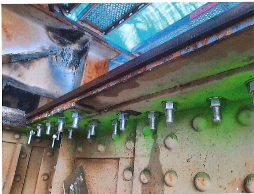
Príprava a montáž spevňovacích prvkov