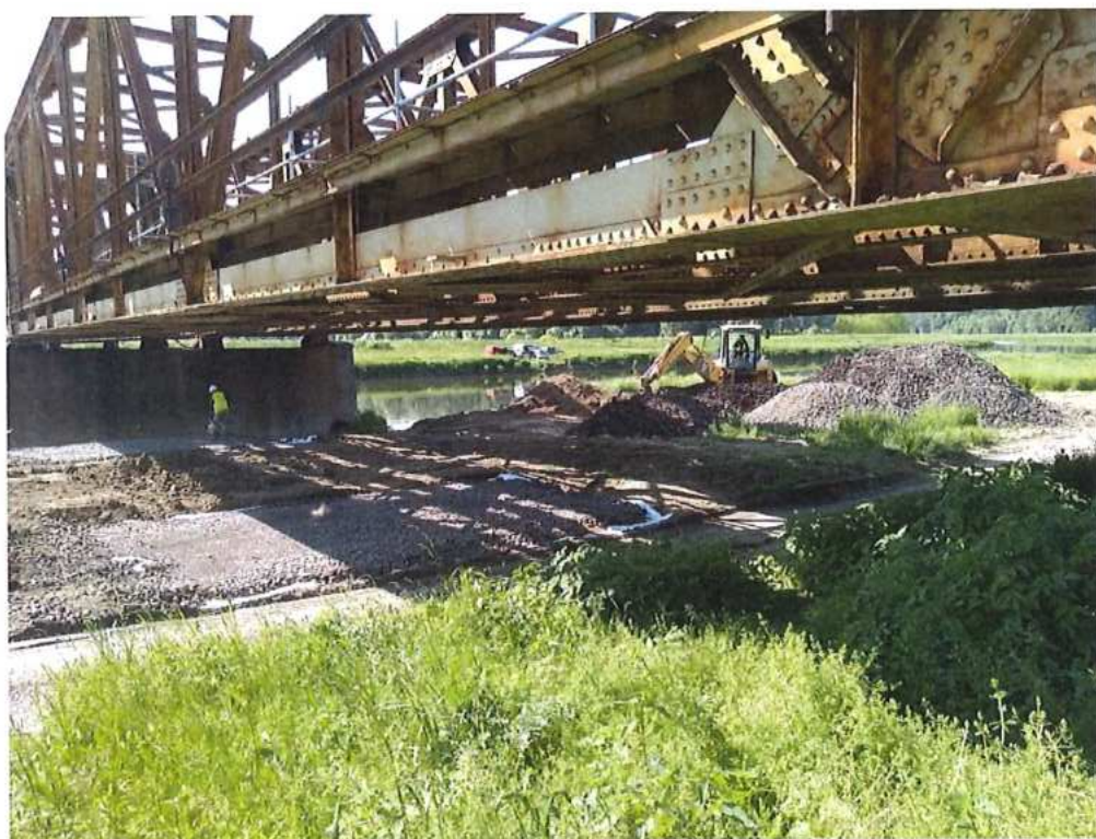
Práce na prístupovej komunikácii - CZ strana