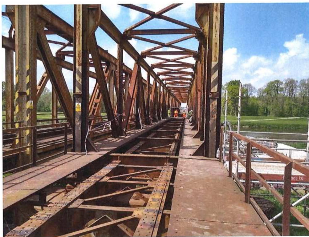
Demontáž koľajového zvršku na moste