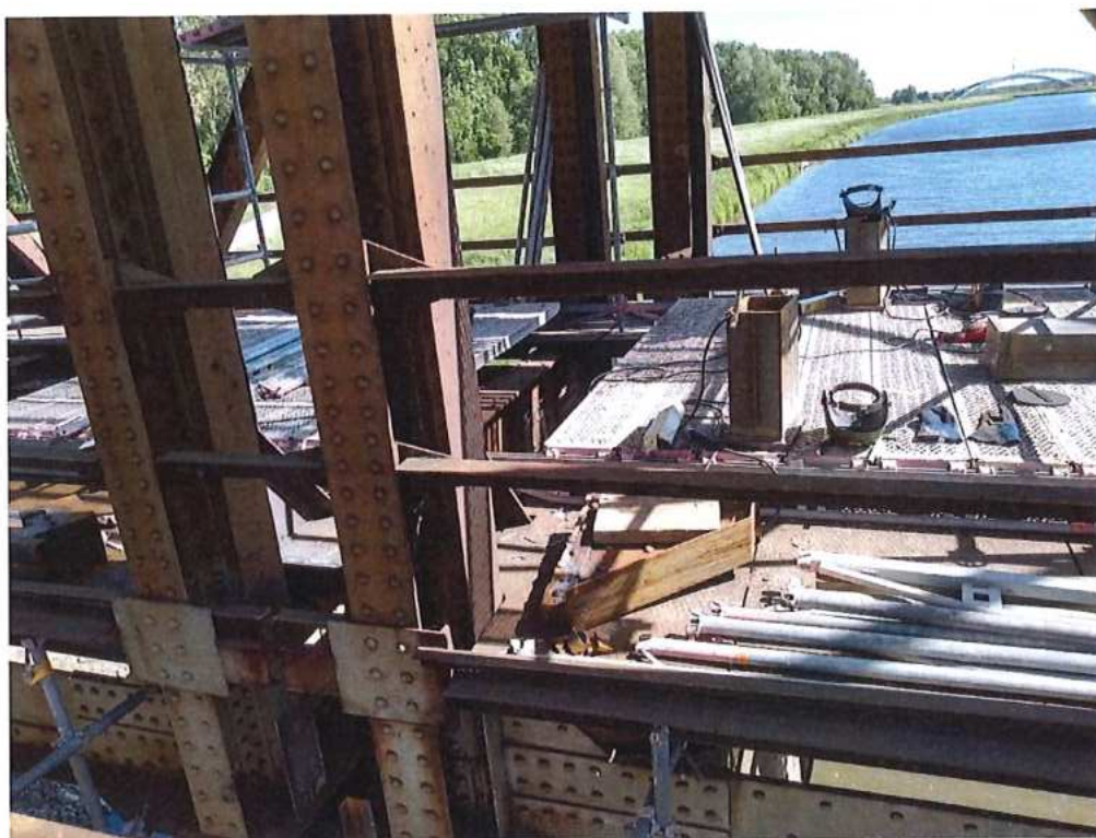
Príprava a montáž spevňovacích prvkov