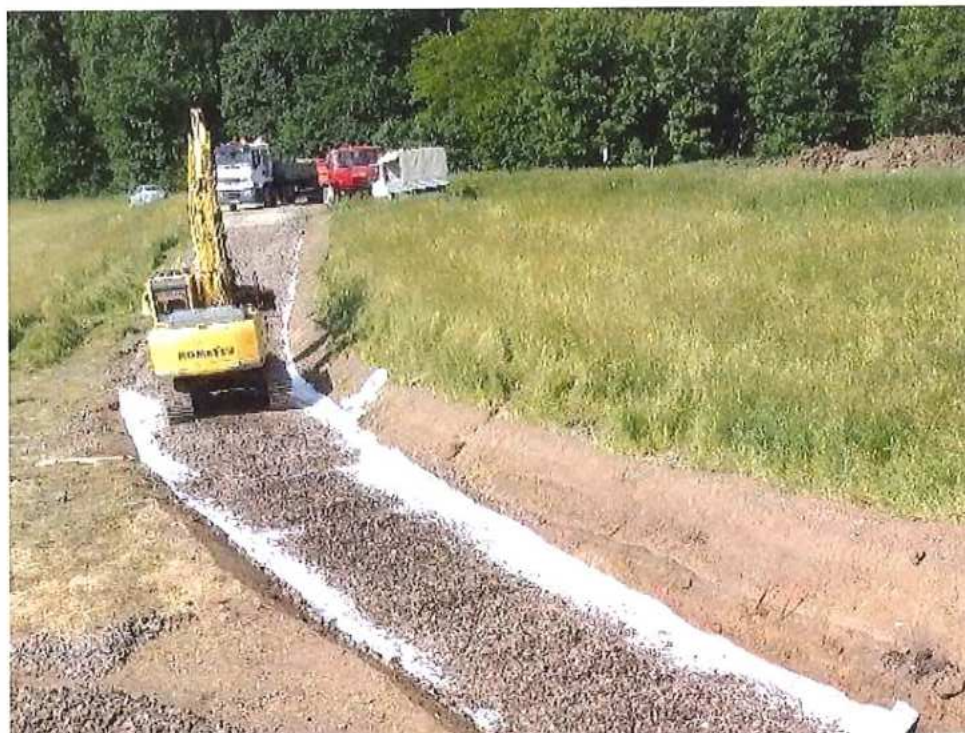
Práce na prístupovej komunikácii - CZ strana